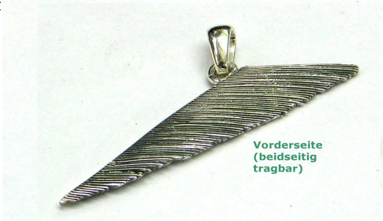
Vorderseite (beidseitig tragbar)