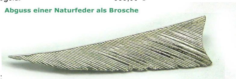
Abguss einer Naturfeder als Brosche